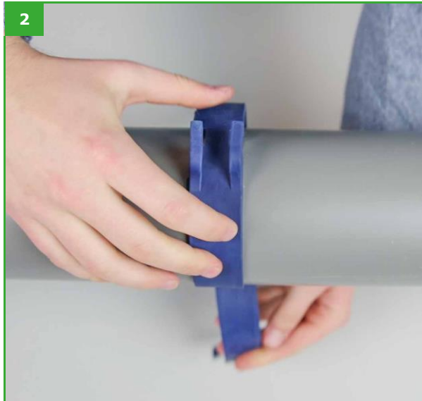
Plaats de band van de UFO-sluitstrip rond de rioolbuis (buitendiameter van 110 - 125mm).