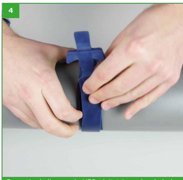
Bevestig de lip van de UFO-sluitstrip onder de haken van het bevestigingssysteem.